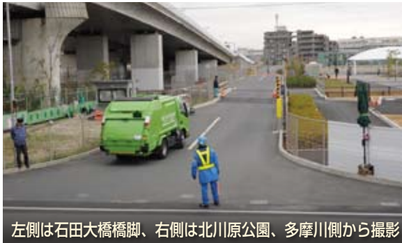
左側は石田大橋橋脚、右側は北川原公園、多摩川側から撮影

日野市の第二次ごみ改革の一環として、老朽化が進む現在の可燃ごみ焼却炉の代替施設として新たな可燃ごみ処理施設を建設し、日野市・国分寺市・小金井市の三市による広域行政で活用すべく準備を進めてきました。そして、いよいよ令和元年12月19日から新可燃ごみ処理施設へ日野市・国分寺市・小金井市の可燃ごみの搬入を開始しました。これから新可燃ごみ処理施設の性能テストを行い、様々な状況を確認していきます。本格稼働は本年4月からを予定しています。