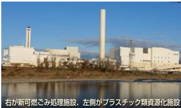
右が新可燃ごみ処理施設、左側がプラスチック類資源化施設